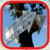
Theetuin Klarenbeek Klarenbeek Farm