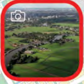
Landelijke Route Countryside