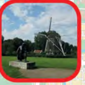
Rembrandtmonument Rembrandt statue