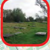
Both Haim Jewish Cemetery 1614