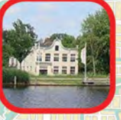
Wester-Amstel Golden Age building