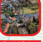
Historisch Centrum Historical Centre