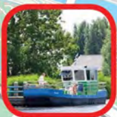
Pont De Smient Ferry The Smient