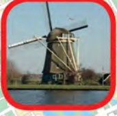
Molen De Zwaan The Swan mill