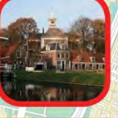
Museum Amstelland Historical museum