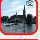
Uitzicht op de Amstel Amstel view