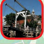
Kerkbrug Small Skinny Bridge